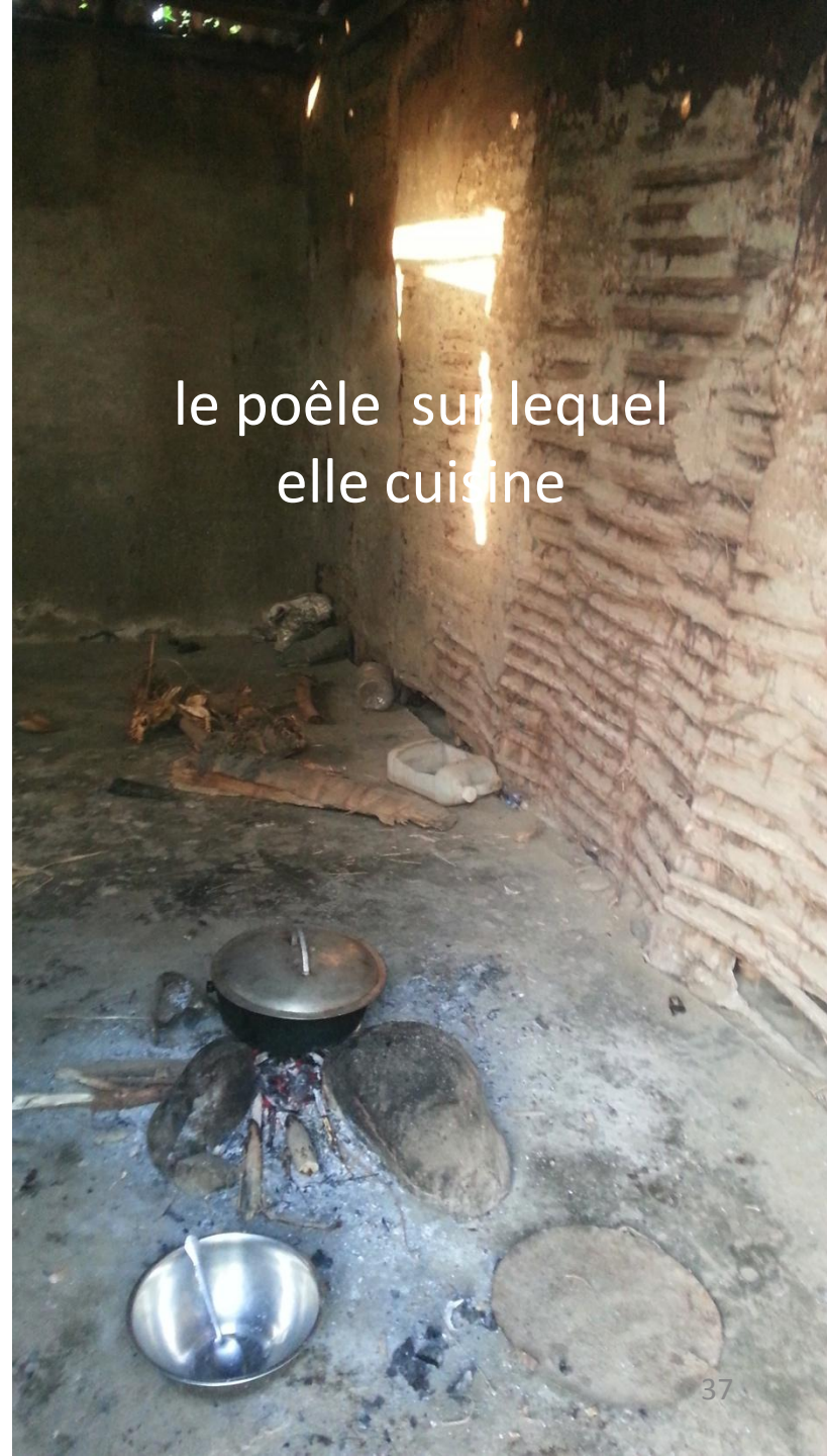
le poêle sur lequel elle cuisine