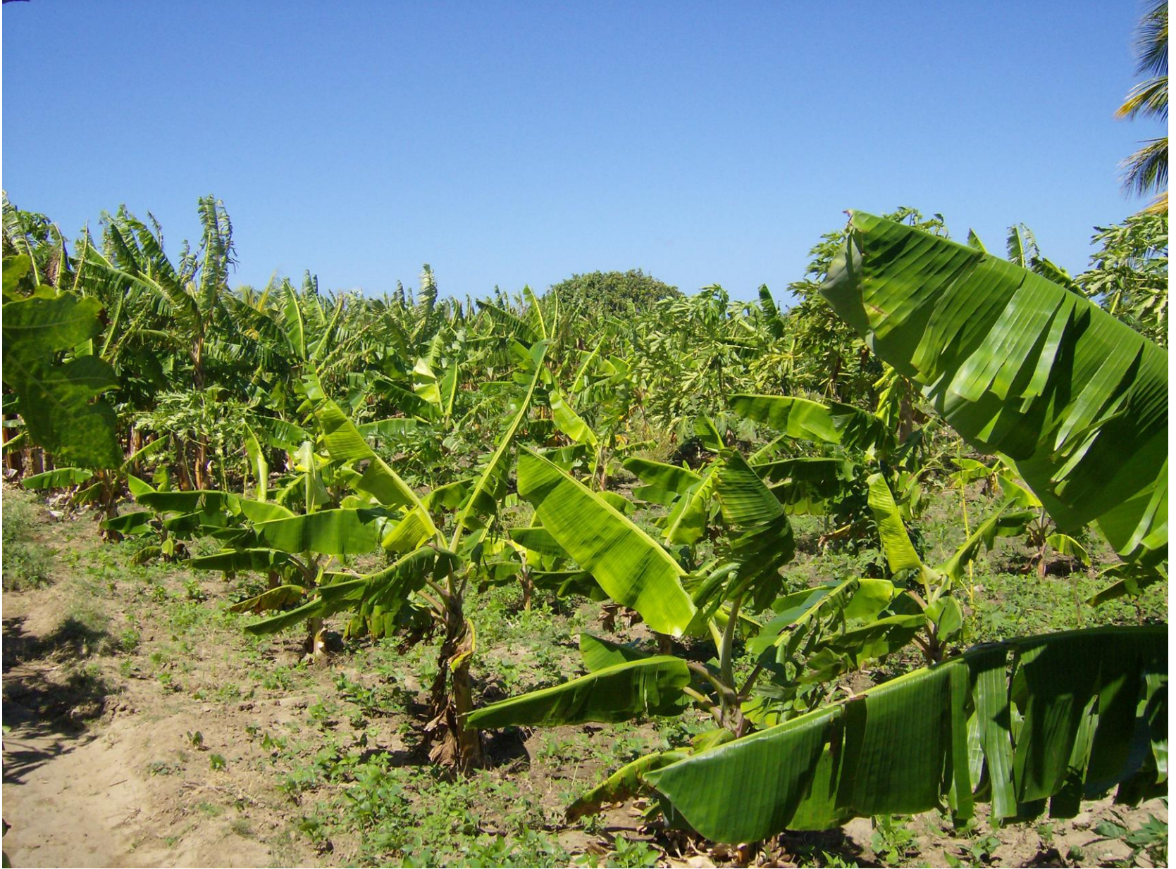
La Bananeraie avant le passage d'Irma en 2017