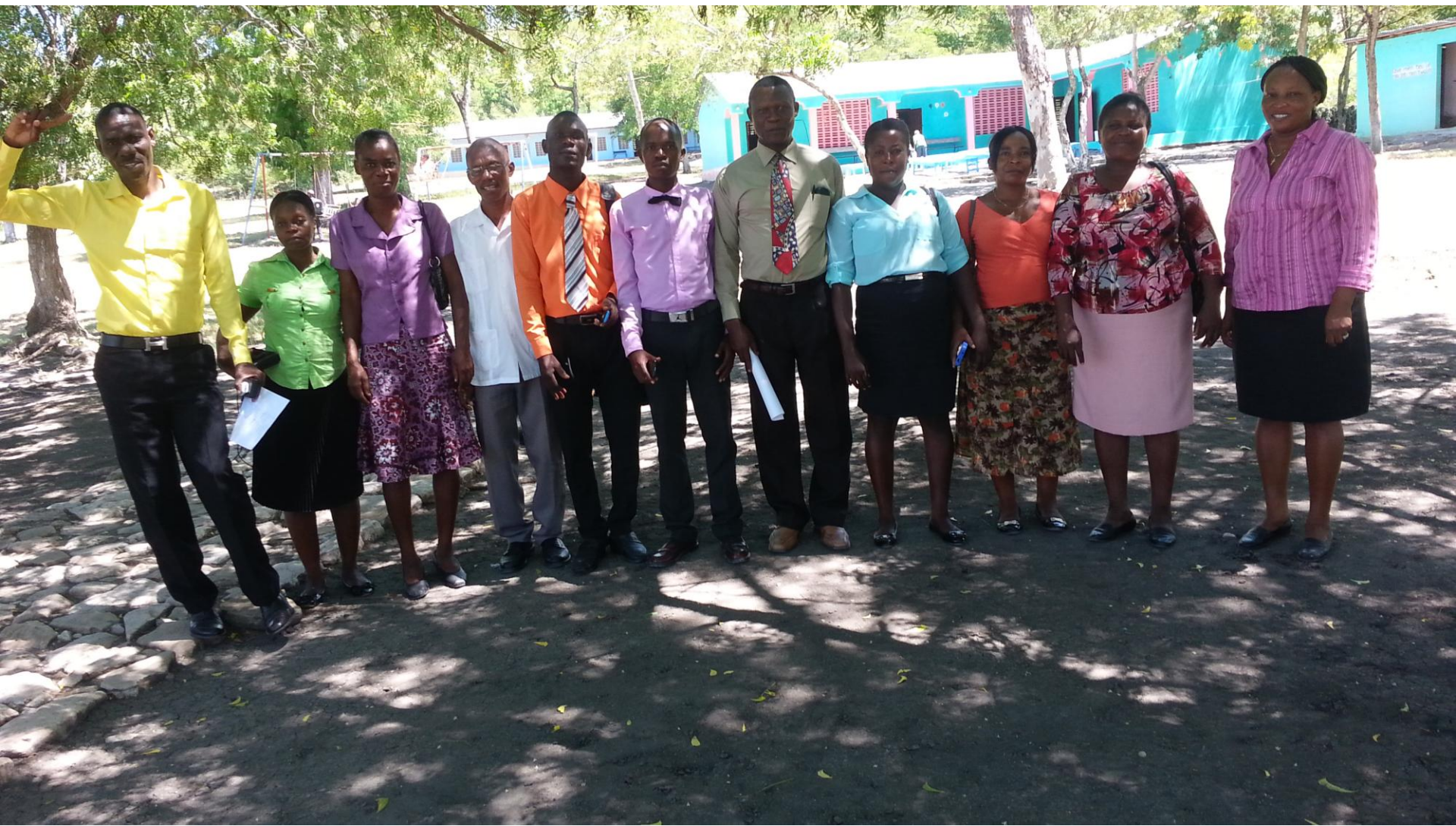
Une partie du groupe des enseignants