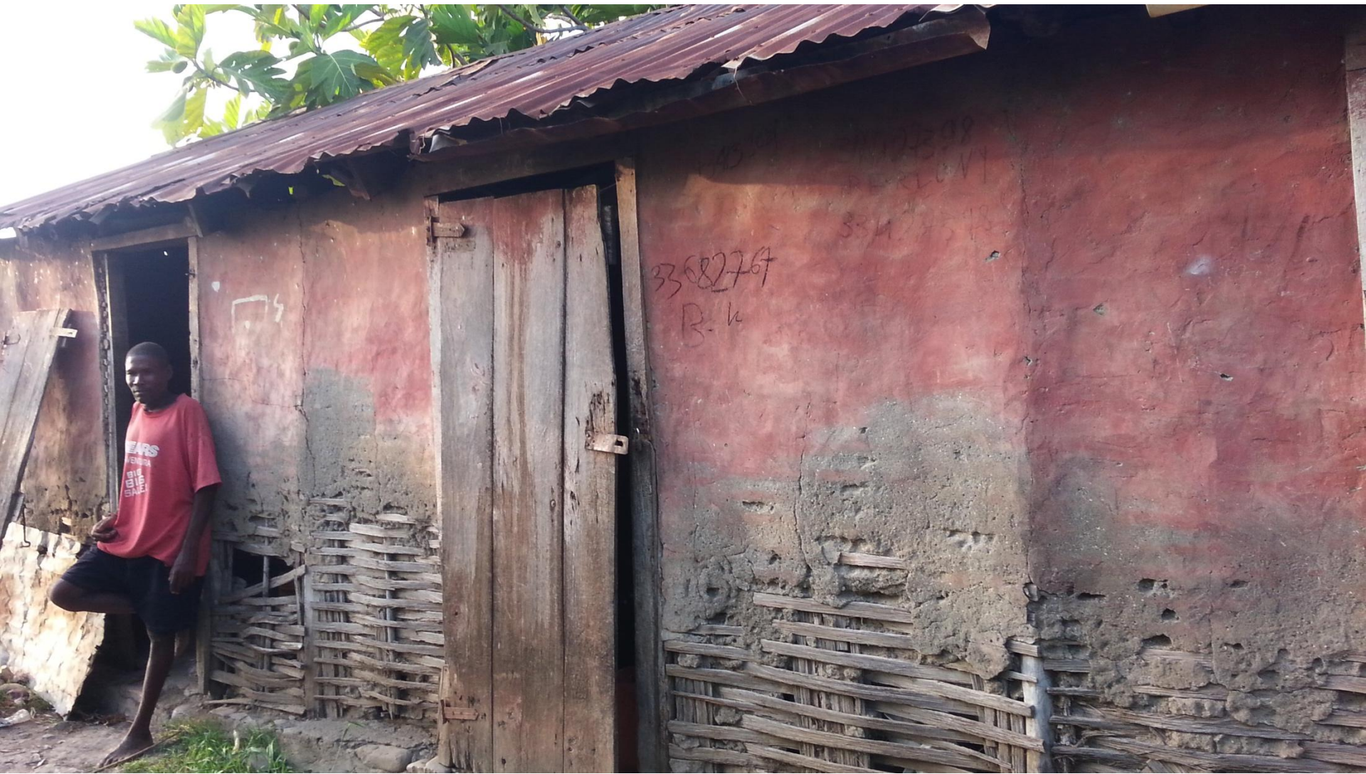
La maison qui abrite les travailleurs de la bananeraie