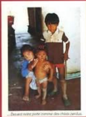
...Devant notre porte comme des chiens perdus.

Dans des sanglots dans la nuit. Foulquier décrit la souffrance que vivent les enfants des rues de Bogota spécialement le sort réservé aux petites filles vendues pour la prostitution