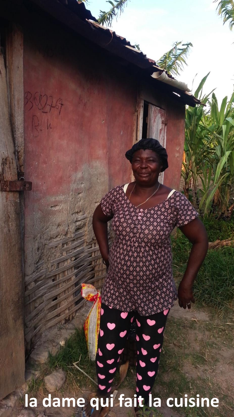
la dame qui fait la cuisine