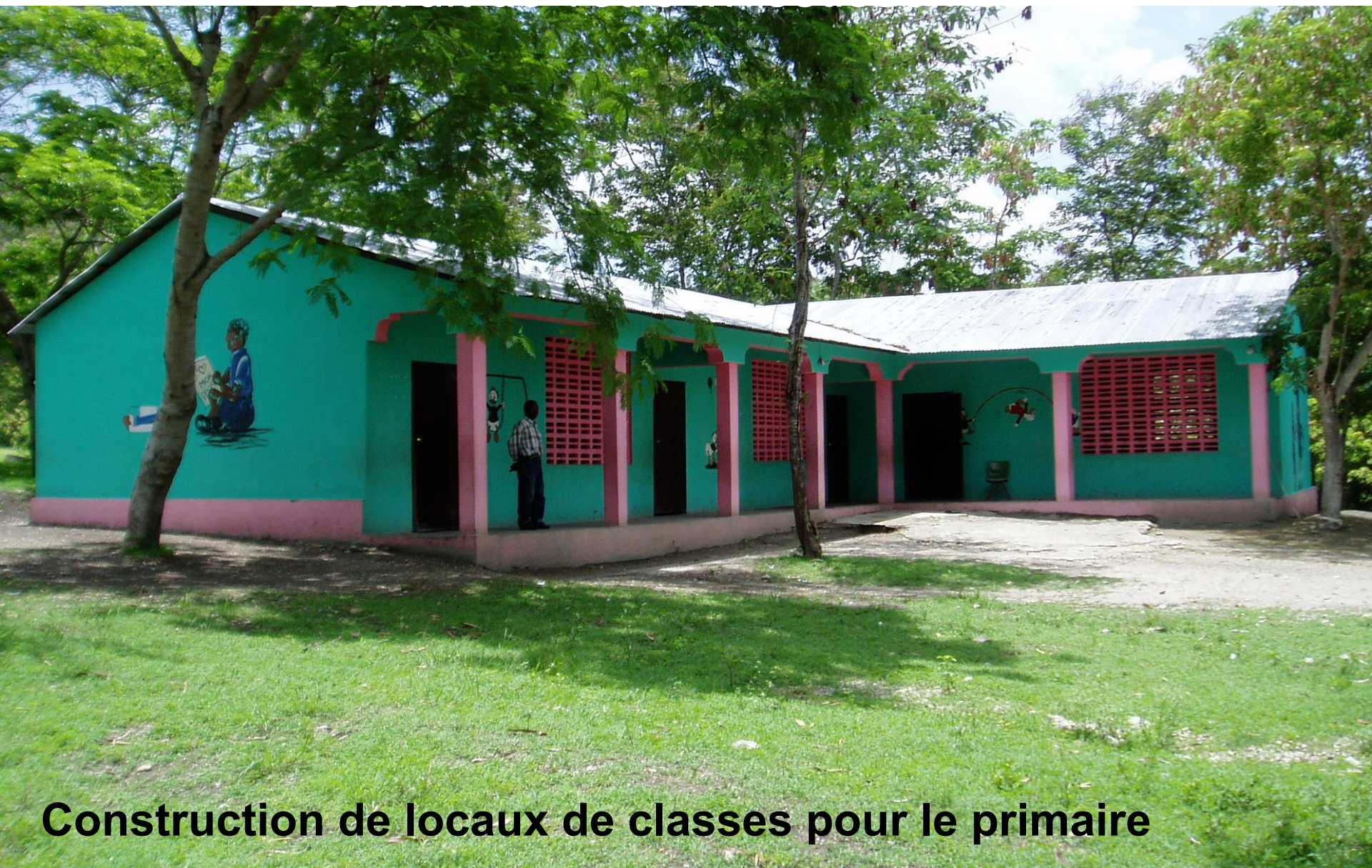
Construction de locaux de classes pour le primaire