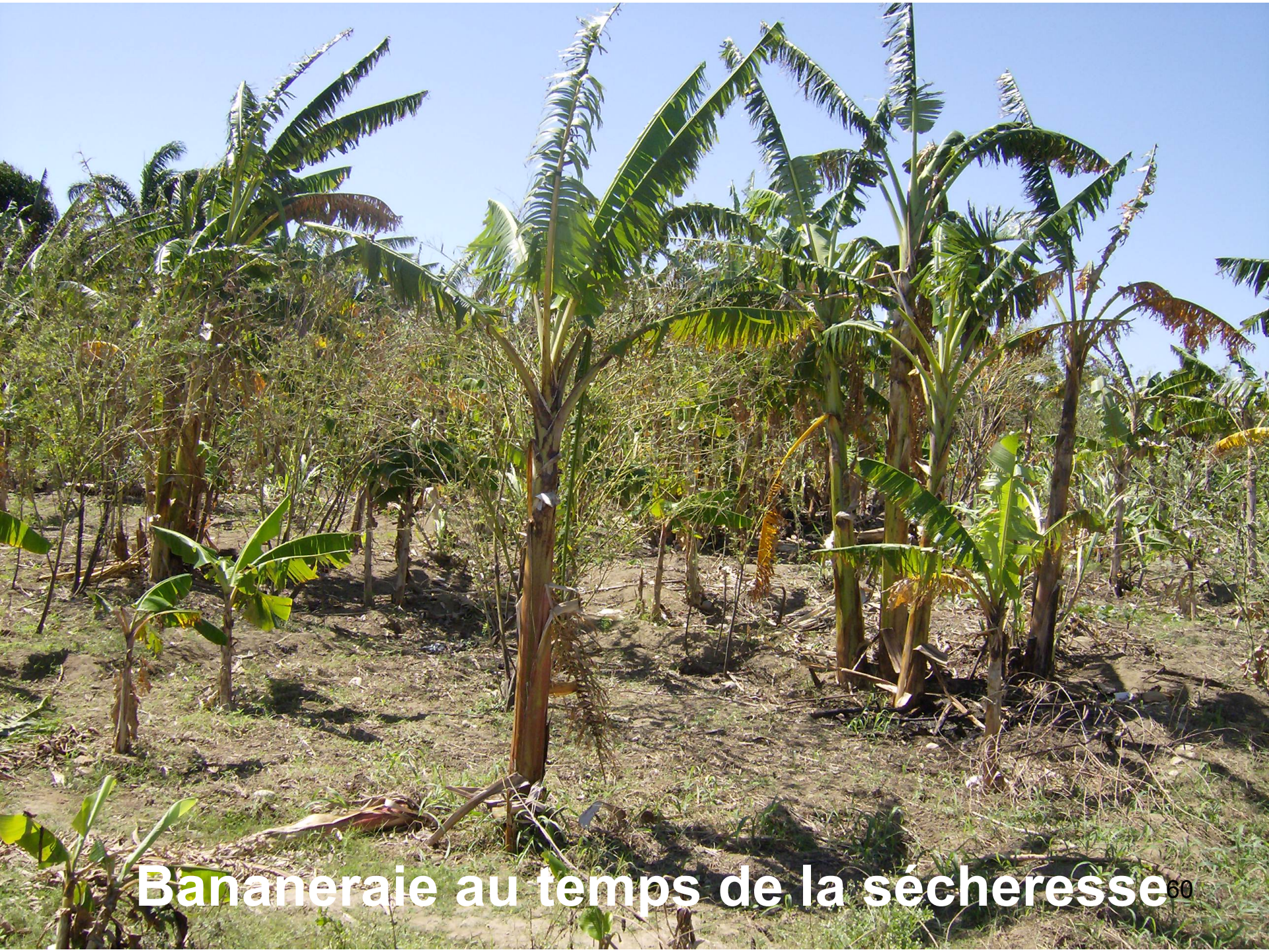
Bananeraie au temps de la sécheresse 60