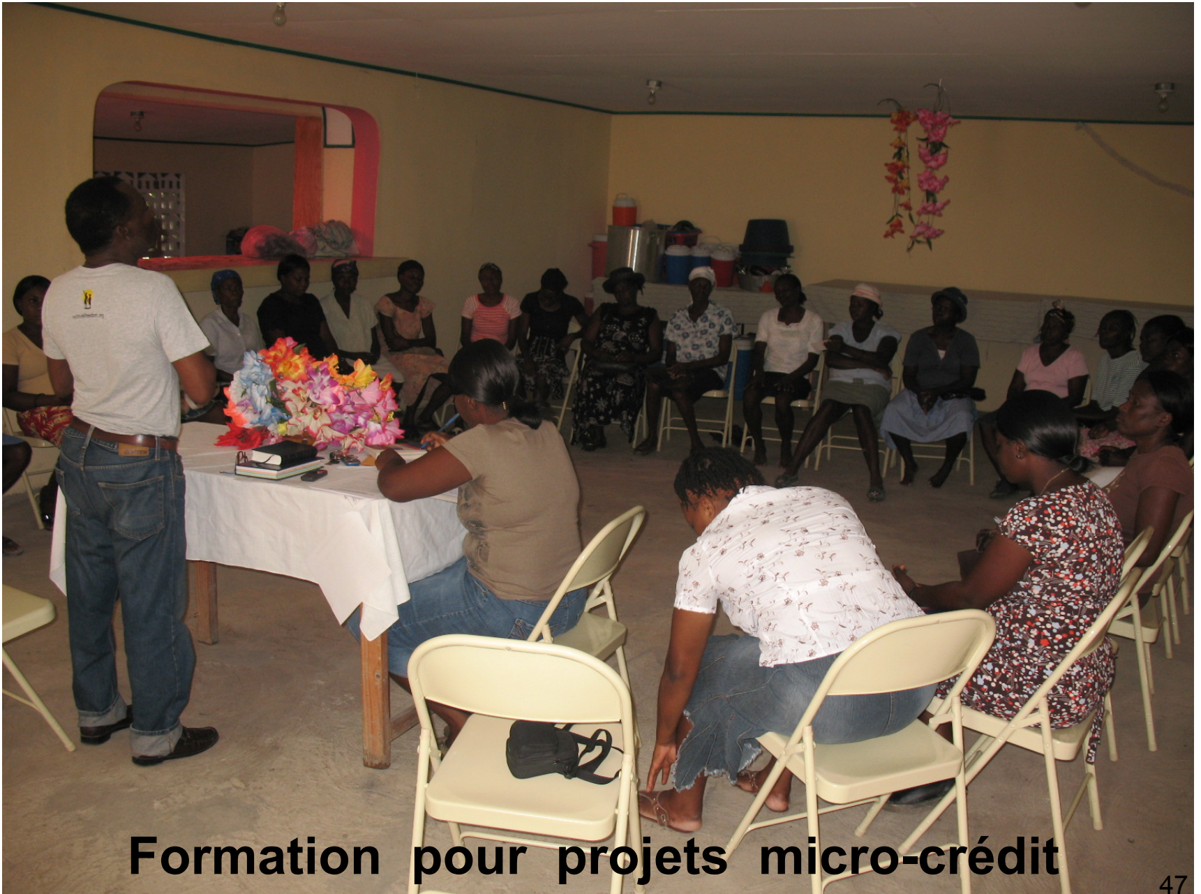
Formation pour projets micro-crédit