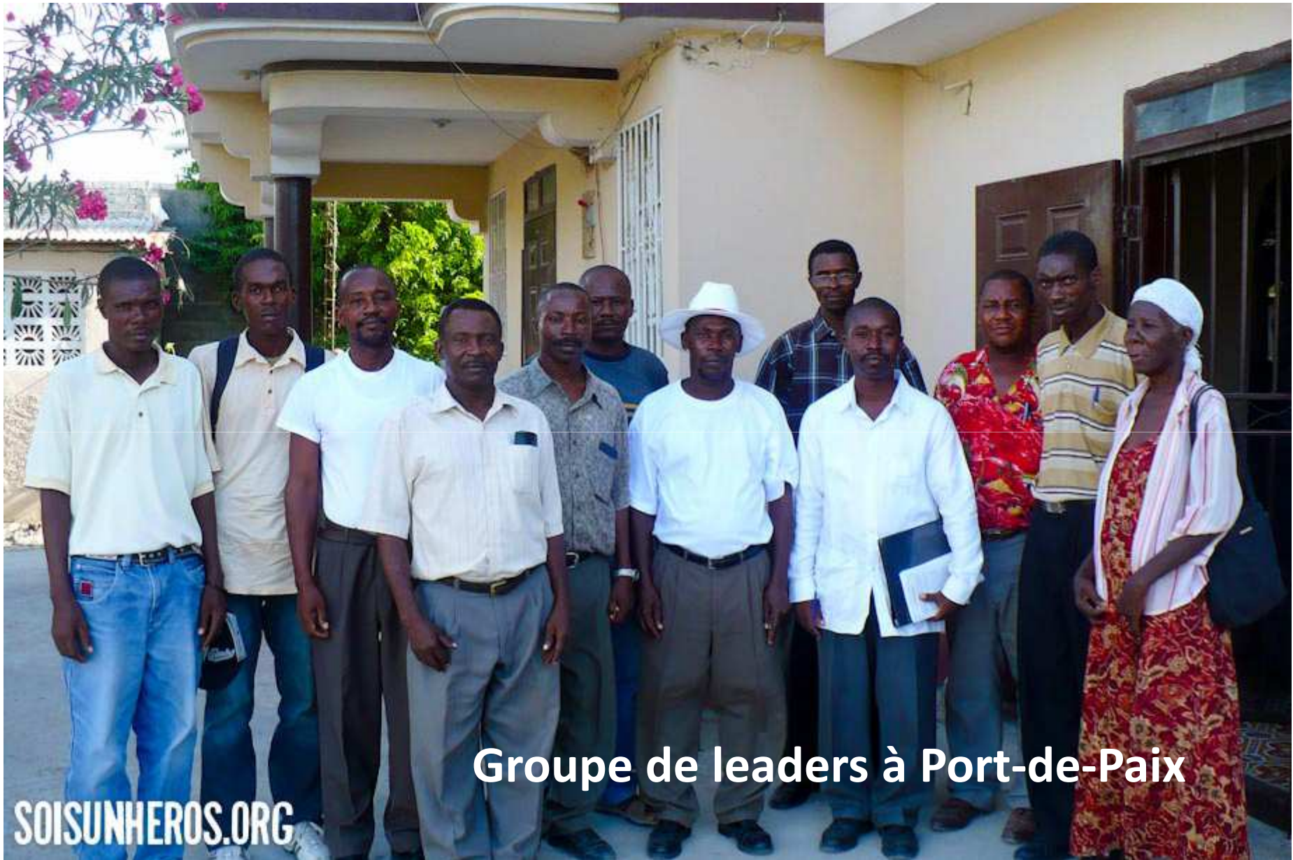
Groupe de leaders à Port-de-Paix