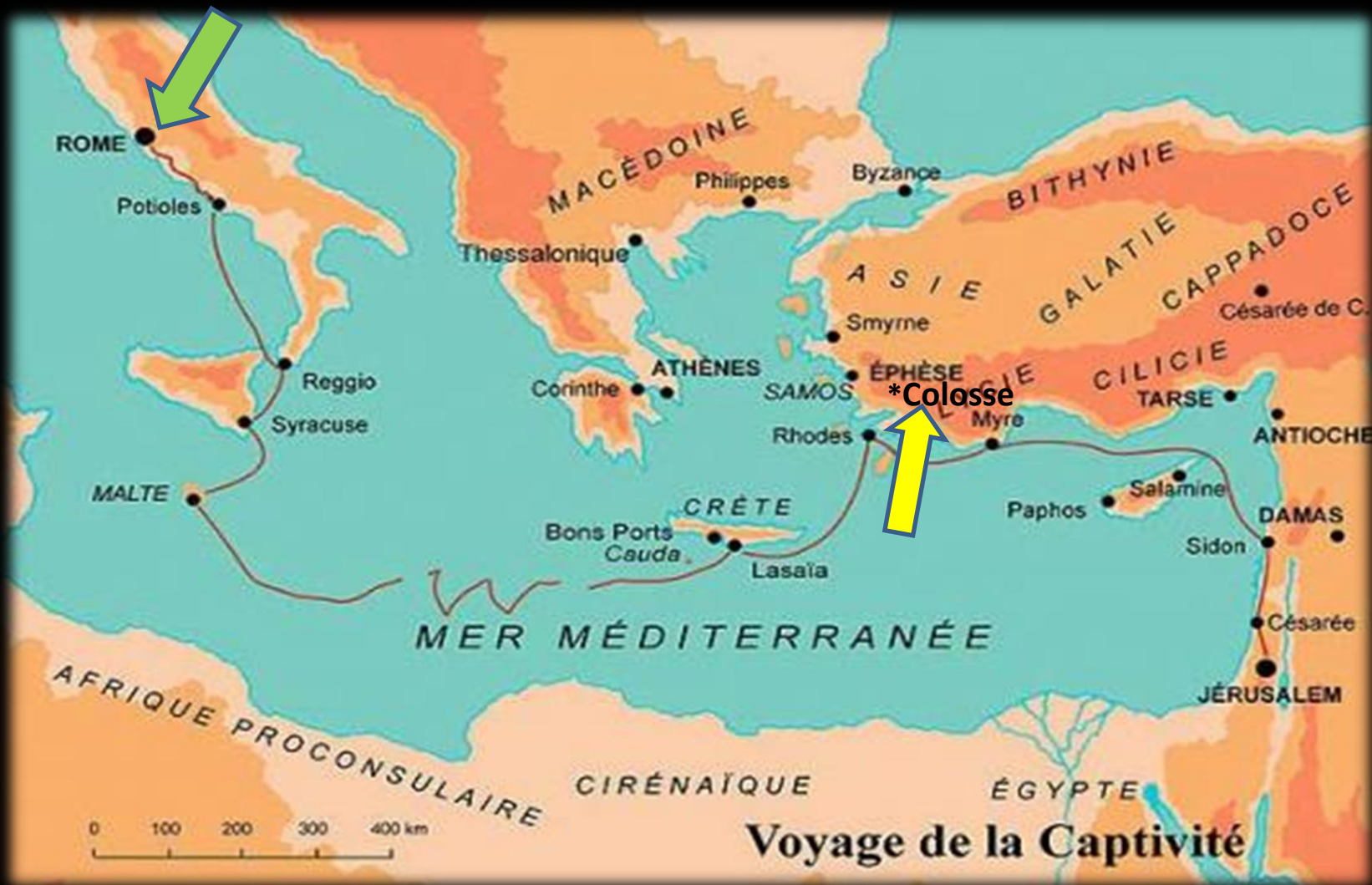
Voyage de la Captivité