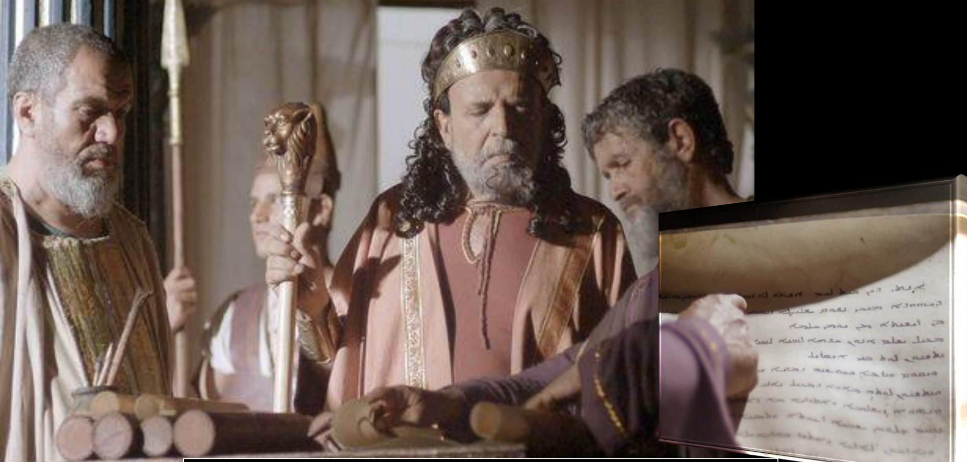
Le 3 e portrait: les religieux de l'époque! L'indifférence un grand danger de la vie spirituelle